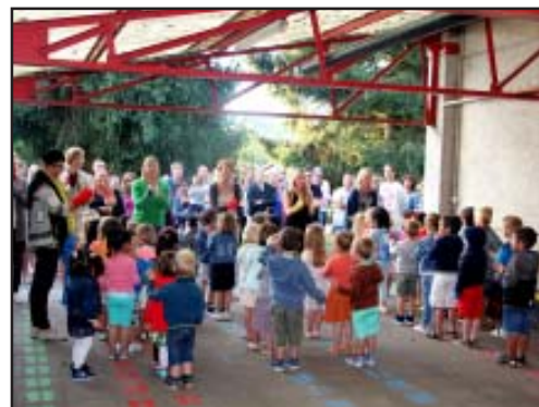
Onze kleuters bij de start!