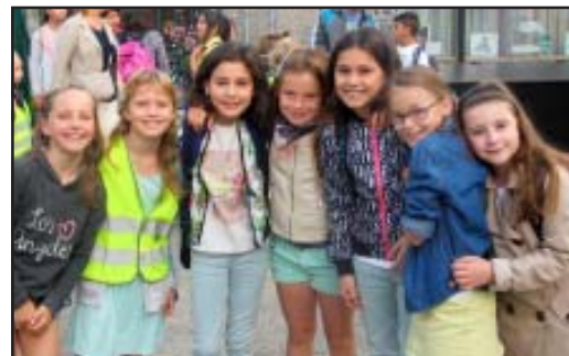
Een blij weerzien op het Kapelhof